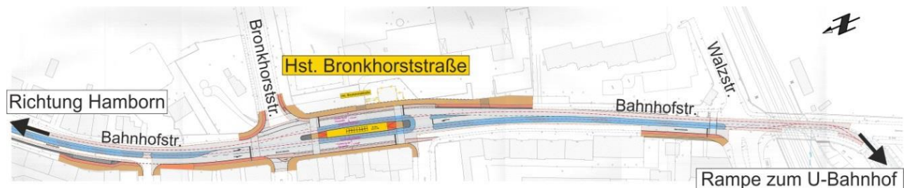
Projektplanung – Auszug: Bereich Haltestelle Bronkhorststraße

Die betrieblichen und verkehrlichen Ziele der Maßnahme sind: