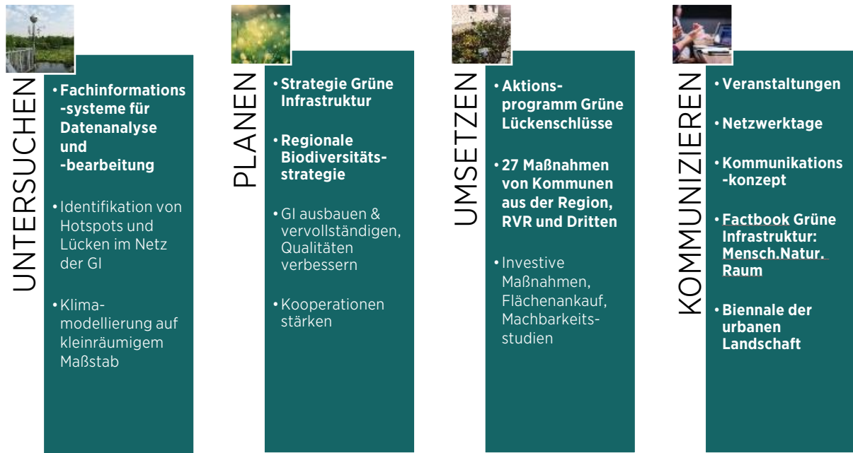
Abbildung 1: Bausteine der Offensive Grüne Infrastruktur 2030

Charta und Strategie Grüne Infrastruktur sind aus dem Leitprojekt „Offensive Grüne Infrastruktur 2030“ heraus entwickelt worden. Weitere Bestandteile der Offensive sind die Entwicklung der regionalen Biodiversitätsstrategie, die Umsetzung des „Aktionsprogramms Grüne Lückenschlüsse“ mit insgesamt 27 Einzelmaßnahmen, die Entwicklung von Daten- und Analysetools sowie diverse Kommunikationsmaßnahmen und Veranstaltungen wie die Netzwerktage zur Grünen Infrastruktur in 2020 und 2022 (siehe Abbildung 1).