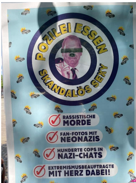
Verunglimpfung des Essener Polizeipräsidenten