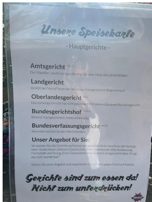
Verunglimpfung der Justiz