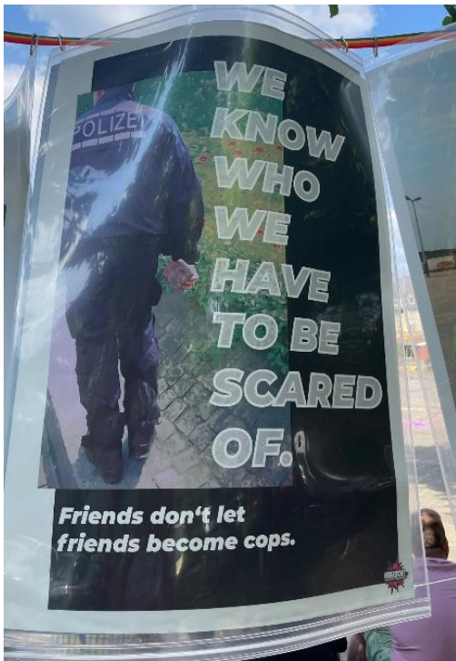
Friends don't let friends become cops