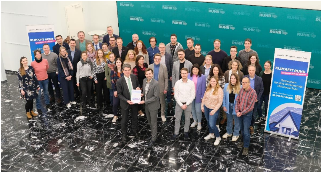
Abbildung 1: Alle Projektpartner von Klimafit Ruhr beim ersten Partnertreffen in 2024 am 18. März