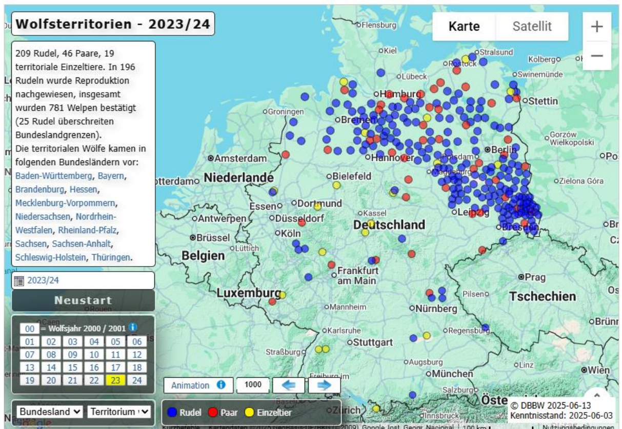
Abbildung 3: Darstellung der Wolfsterritorien im Jahr 2023/2024 - DBBW: Abfrage 13.06.2025

Grundsätzlich sind Schätzungen von Populationsgrößen sehr schwierig und unterliegen einer gewissen Ungenauigkeit. Die besten Zahlen finden sich auf der Seite der DBBW (Dokumentations- und Beratungsstelle des Bundes zum Thema Wolf; www.dbb-wolf.de ).