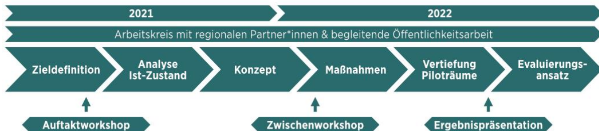
Abb. 1: Phasen und Zeitplan der Erarbeitung

Die Erarbeitung des Regionalen Freizeitmobilitätskonzeptes für die Metropole Ruhr erfolgte in fünf Phasen (1: Zieldefinition, 2: Analyse Ist-Zustand, 3: Konzeptentwicklung, 4: Maßnahmen und 5: Vertiefung in Piloträumen; vgl. Abbildung 1). Die Inhalte der einzelnen Arbeitsphasen sind der Kurzfassung (Anlage 1) und dem Endbericht zum Regionalen Freizeitmobilitätskonzept (Anlage 2) zu entnehmen.