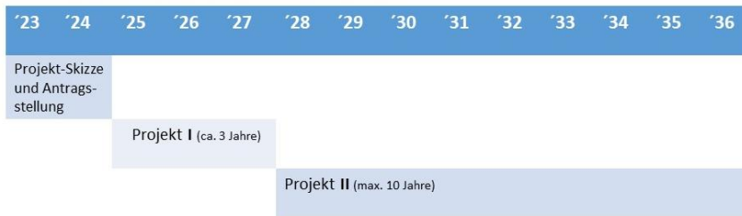
Abb. 1: Phasen des Projektes

Die Förderquote beträgt insgesamt 90 %. Hierbei übernimmt das BfN einen Förderanteil von 75% und das Land NRW einen 15%igen Anteil.