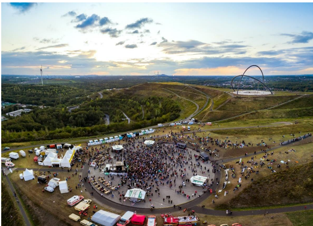
„Sunset Picknick“ Hoheward 2019