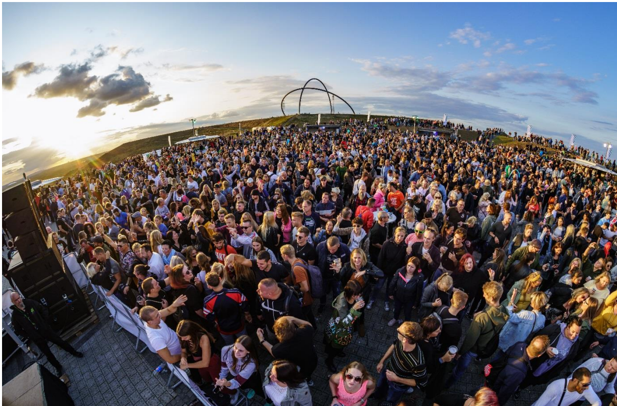
„SunsetPicknick“ Hoheward 2019 (mit im Tagesverlauf rd. 9.000 Besuchern)