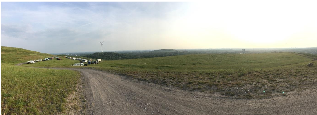
Beispiel einer Veranstaltungs-Nutzung des Westplateaus: „Kustom Kulture Forever“, Areal Zeche Ewald, Halde Hoheward als Festival-Campingplatz für Wohnwagen/Wohnmobile

Der sogenannte Holzlagerplatz des ehemaligen Zechengeländes auf der Recklinghäuser Seite der Halde Hoheward wird zurzeit noch durch Materiallagerungen für den Ausbau der angrenzenden A 43 genutzt. Im Rahmen des Förderprogramms „Aktionsprogramm Grüne Lückenschlüsse“ der GI Offensive wurde durch das Planungsbüro Förder Architekten eine Planung für eine multifunktionale Grünfläche erarbeitet. Diese beinhaltet neben festinstallierten Parkplätzen auch Wohnmobilstellplätze und weitere Bedarfsstellplätze bei Großveranstaltungen.