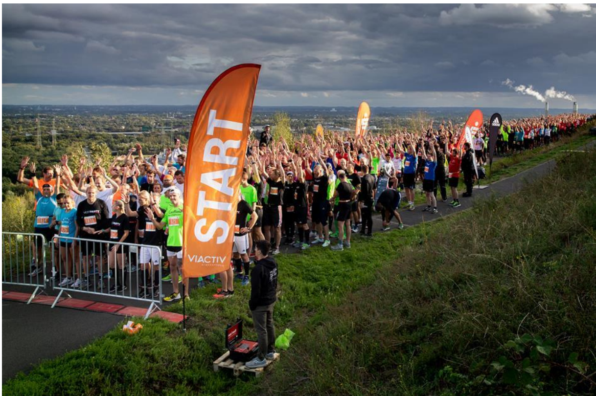
Abb.: „Top Run Ruhr“ Firmenlauf, Hoheward (mit über 2000 Teilnehmenden) (Foto: Thomas Nowaczyk, 2019)